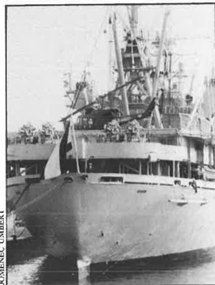
El portaavions 'Príncipe de Asturias'.

Els grups detractors han tingut raons de pes en aquesta ocasió per a oposar-se a les celebracions militars del cap de setmana, la majoria d'elles basades en simples contradiccions oficials que després els esdeveniments no han fet més que accentuar. Les organitzacions oposidores més destacades han estat els partits Iniciativa per Catalunya (IC), Esquerra Republicana de Catalunya (ERC) i el Partit dels Comunistes de Catalunya (PCC), a part dels grups Crida a la Solidaritat i la Coordinadora per al Desarmament i la Desnuclea-