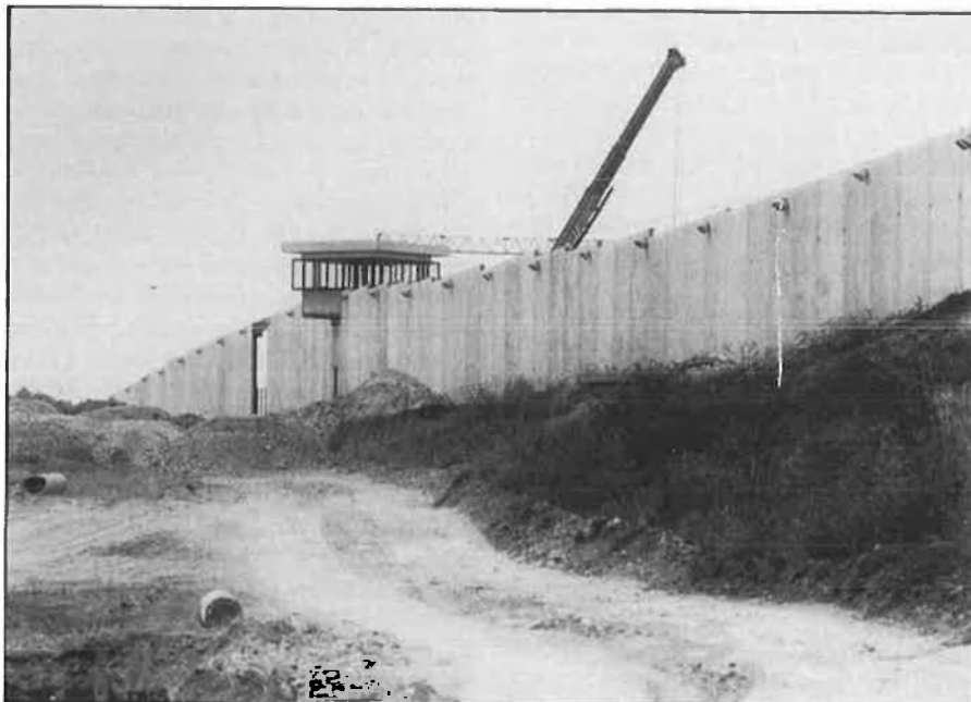
El futur centre de Picassent superarà Alcalá-Meco.