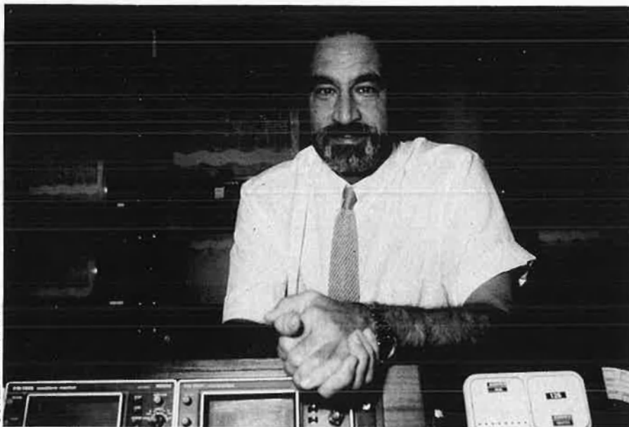
«S'ha de suscitar l'hedonisme ecològic».

vol manera. Pel que respecta a l'auto-pista, és una obra prou important perquè pugui afectar en alguns llocs. Si interromp sistemàticament els cursos de drenatge de valls successives pot crear problemes d'inundacions. Però si es posen tubs d'evacuació, el problema no es presenta. En tot cas l'auto-pista consumeix un espai i instaura una barrera física. Es pot convertir en un problema, però tot depèn dels sistemes de comunicació que per sobre o per sota es facin.