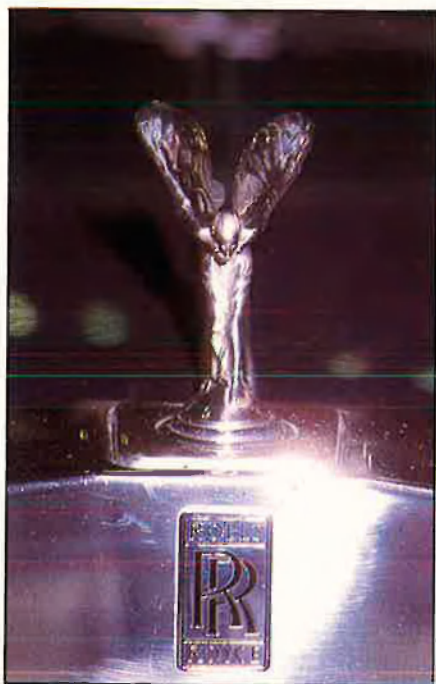
Rolls Royce Silver Spirit, un cotxe luxós per a un preu també de luxe: 22 milions de pessetes.