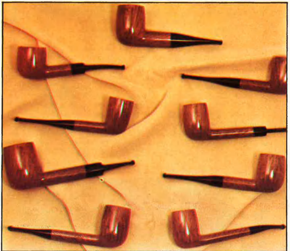
Les dues empreses valencianes que encara fabriquen pipes no superen els 15 treballadors de mitjana.

quals destaquen les alemanyes. Són sobretot pipes de col·leccionista.