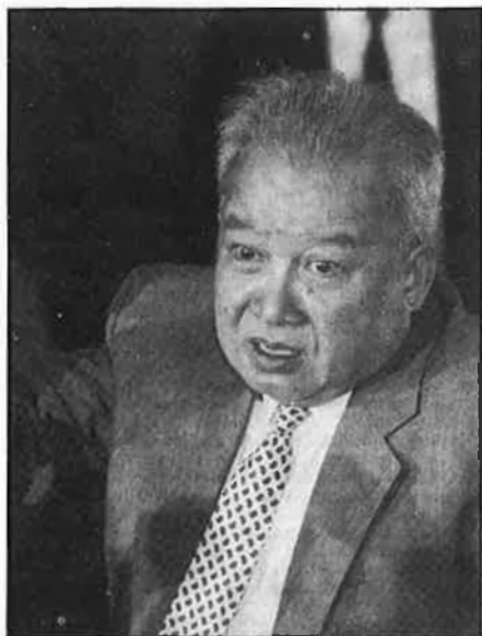
Príncep Sihanouk, monarca cambotjà.

P ocs dies abans de la històrica visita a Xina de Mikhaïl Gorbaxov, vietnamites i xinesos han donat un pas significatiu en el complicadíssim intent de solució del problema cambotjà. Xina ha fet públic que creu en la promesa de Vietnam que retirarà les seues tro-