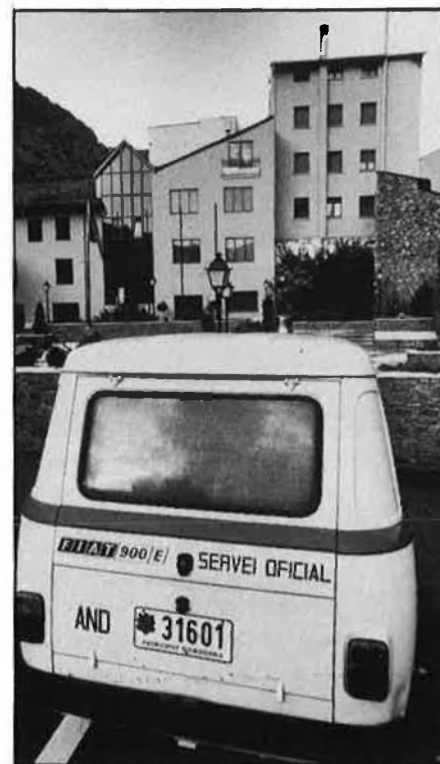
Tràfic de diners a Andorra, ús i costum assumit.