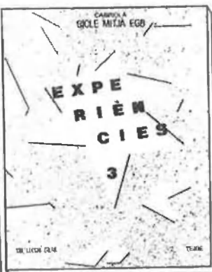
EXPERIÈNCIES Cicle Mitja 3r EGB Col·lecció Graó Cabriola