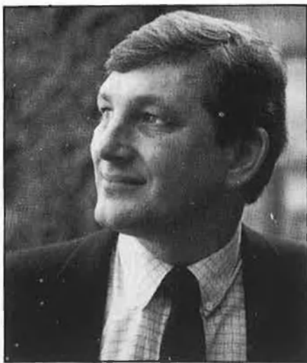
Trevor Pinnock, amb The English Concert , és l'actuació més esperada del Festival.

Per a Herreweghe aquesta música aporta uns components d'espiritualitat que justament són absents de la música actual i que els atreu. Una espiritualitat que segons aquest músic, també troben els joves en el rock en certa me-