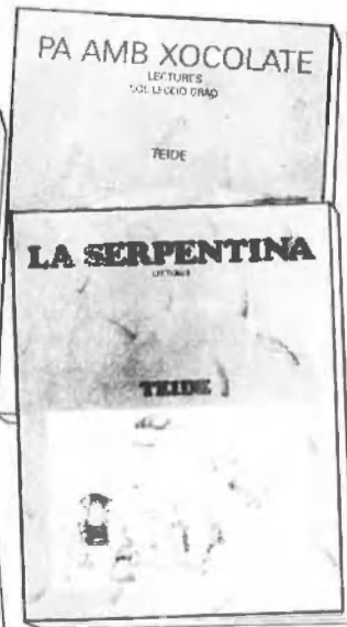
LECTURES Col·lecció Graó Pa amb xocolata La serpentina