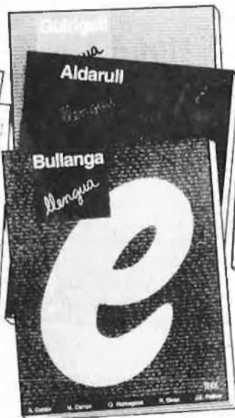
LLENGUA 1. Guirigall 4. Comboi 2. Bullanga 5. Gatzara 3. Aldarull