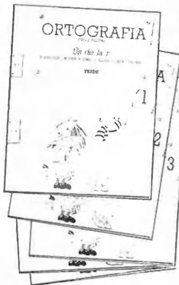
QUADERNS D'ORTOGRAFIA - Cicle inicial - Cicle mitjà - Cicle superior