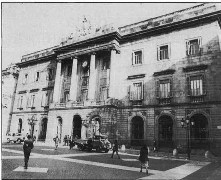
Al Saló de Cent de l'Ajuntament de Barcelona se celebrarà el lliurament dels premis.

QUASI 500 ANYS DESPRÉS, ELS JOCS FLORALS CONTINUEN SENT UNA DE LES FESTES MÀXIMES DE LA POESIA