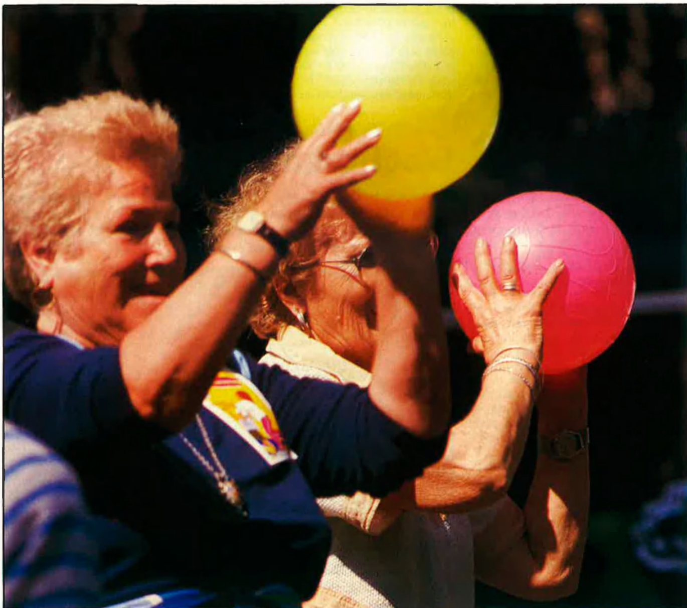
Els jubilats no podran continuar cobrant les pensions guanyades amb el seu treball.

ser retribuïdes mitjançant les contribucions dels treballadors en actiu del mateix any. Aquest sistema, però, ha esdevingut deficitari, de tal manera que, si no fos per les aportacions dels Presupostos Generals de l'estat, els jubilats no podrien continuar cobrant les pensions guanyades amb el seu treball.