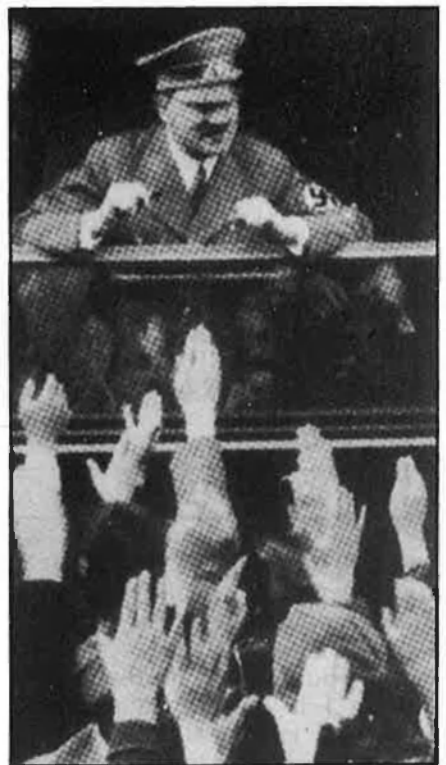
Europa encara tem Hitler.

Però no tot quedà en això. La sorpresa, la donaren les diverses enquestes elaborades per a l'ocasió pels mitjans de comunicació alemanys, segons les quals la imatge que tenen els ciutadans de la RFA sobre Hitler no és tan dolenta com es podria esperar. En totes, entre un 40 i un 44 per cent de la ciutadania, considera que Adolf Hitler va ser un gran estadista. Més encara: un 16 per cent dels alemanys occidentals considera que, inclús tenint en compte la guerra i els camps d'exter-