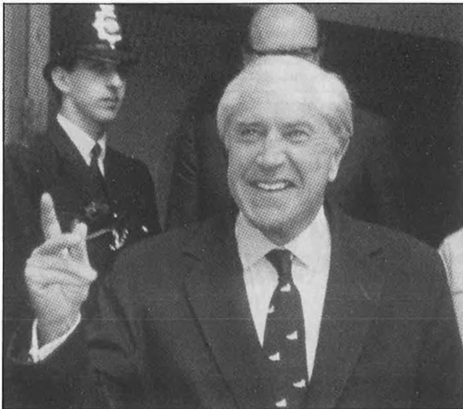
Tiny Rowland, disposat a tot per posseir Harrods.

T iny Rowland té els ulls blaus, com pràcticament tots els alemanys. En aquest aspecte no es diferencia massa dels milions d'alemanys que hi ha al món. El que fa que Rowland siga distint dels seus compatriotes és el seu sobrenom Tiny, que en anglès vol dir petit, quan gairebé fa dos metres d'alçada, i el fet de ser un dels homes més rics d'Anglaterra.