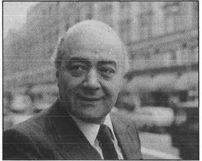
El soldà de Brunei, a l'esquerra, dóna suport econòmic als germans Fayed.