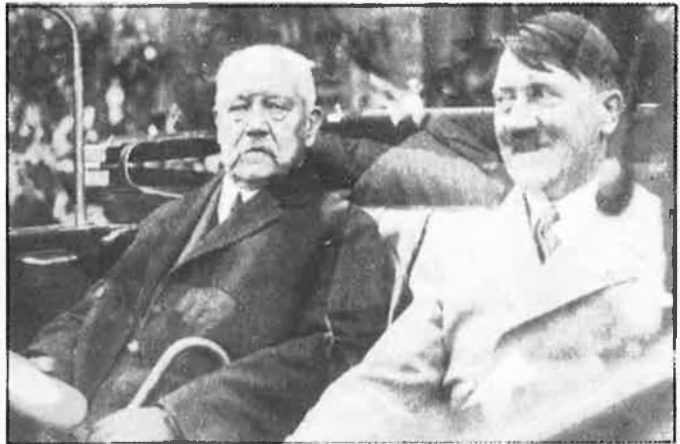
A la mort de Hindenburg, Adolf Hitler (al seu costat en la foto de la dreta) va fer-se càrrec de la presidència.

litzar en favor seu la situació conquerint amb la seva determinació gran part del poble alemany, que els donà democràticament els seus vots per posar fi al sistema democràtic i instaurar una dictadura que va acabar portant a la segona guerra mundial i a la destrucció del país i de tot Europa.