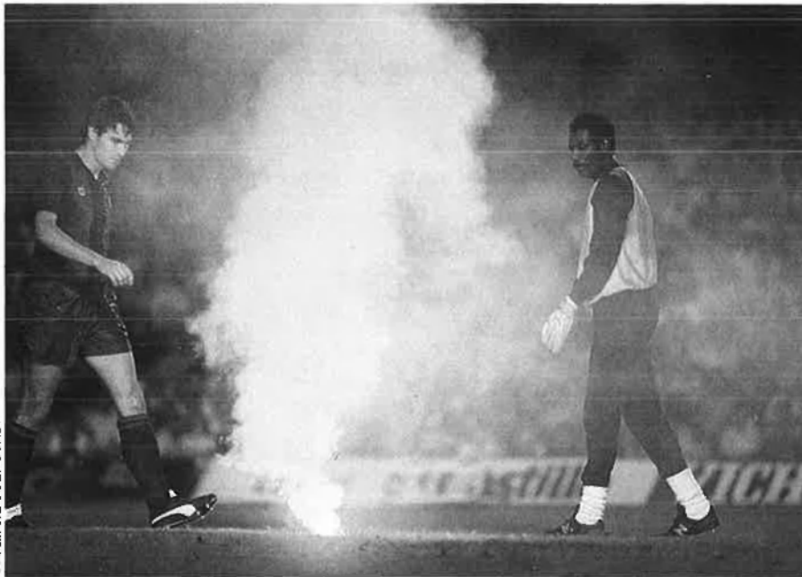
En els partits Barça-Espanyol els incidents són freqüents.