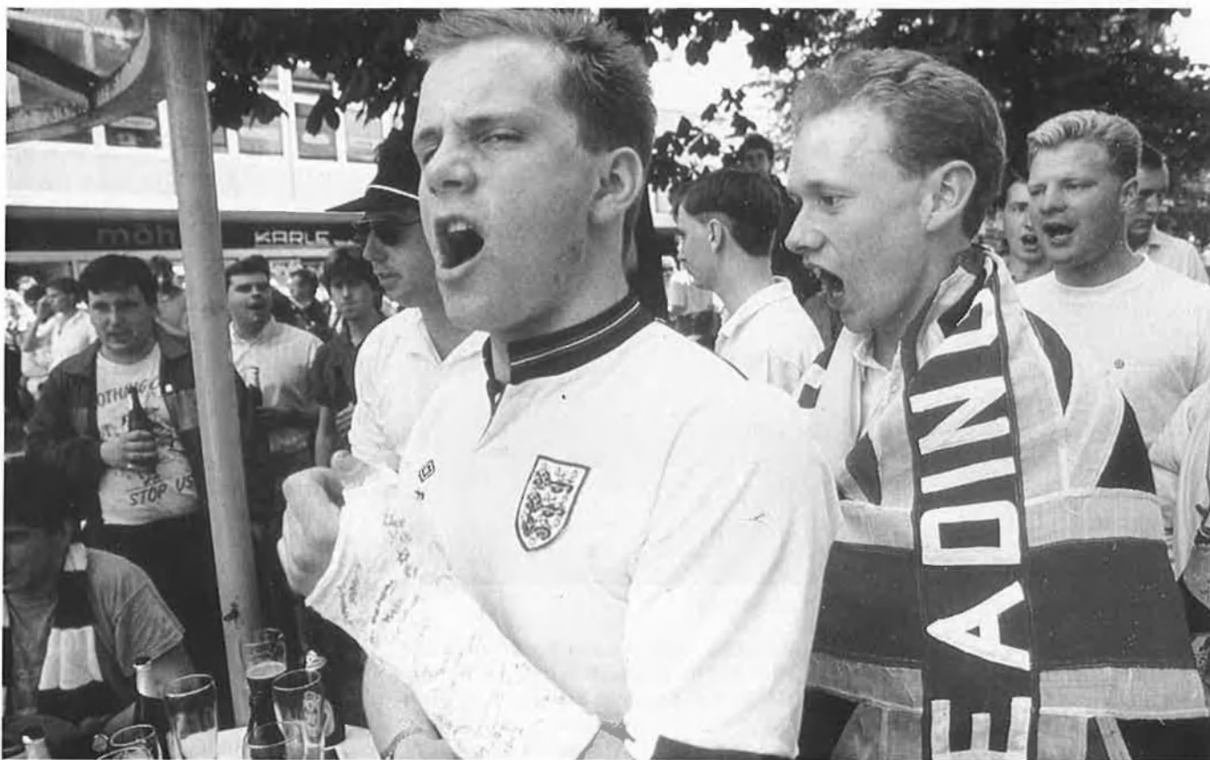
Els 'hooligans' anglesos, es compten entre els més violents del món.

l'estadi Santiago Bernabeu estigué a punt de conèixer problemes semblants quan una vesprada els espectadors van eixir precipitadament i, en la zona que dóna al carrer del Padre Damián, es trobaren amb l'obstacle dels cotxes aparcats a la mateixa eixida de les portes de les taules. A partir d'aquella jornada va quedar prohibit l'estacionament de vehicles en tots els voltants, per tal de facilitar l'eixida sense embuts.