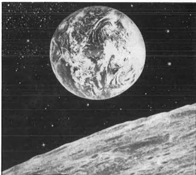
'2001, una odisea del espai' és també una rigorosa meditació sobre la història de la humanitat i una hipòtesi sobre el seu futur moral.

vivència com per a l'anihilació. El rac-cord més famós de tota la història del cinema, l'os que llança a l'aire el simi es converteix en una nau espacial, planteja la hipòtesi bàsica de Kubrick: des del paleolític fins als nostres dies la humanitat ha evolucionat científicament, però no moralment. L'home continua sent, en el fons, aquell simi depredador i assassí.