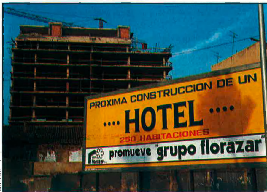
Gandia i Cullera acullen els visitants que no caben a València.

de tres estrelles i 80 places i un altre de dos i 27 places a Gandia. La resta de l'oferta es completa amb un conjunt d'apartaments turístics de 140 places a Benimàmet, i un hotel d'una estrella i 28 places a Almussafes.