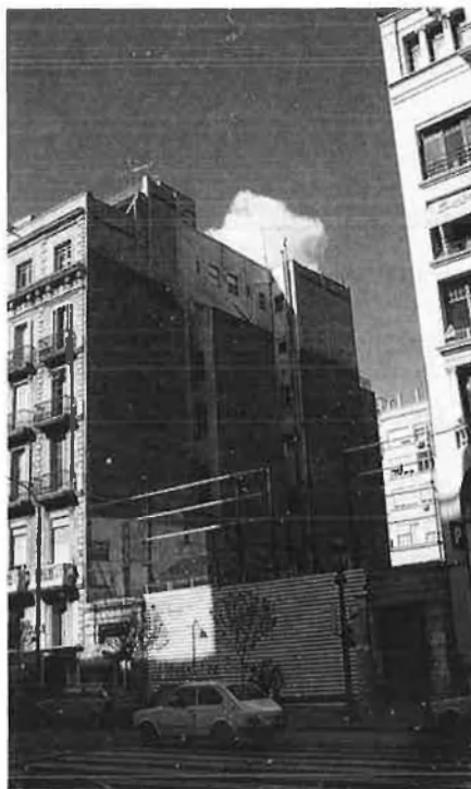
Barcelona ha de duplicar la capacitat hotelera.

Els grups promotors d'aquests establiments es troben repartits majoritàriament entre les cadenes que ja compten amb altres instal·lacions a Barcelona amb algun grup nou. Així, Promotel, SA, de la cadena Derby, i Kasde, són els dos grups dels de cinc estrelles. Keleto, Gallery Centre, Hilton, Borrell i Cadena Hespera, es re-