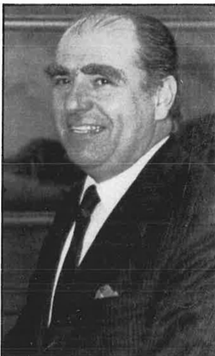
Julio María Sanguinetti.

Els militars uruguaians van haver de cedir el poder als civils i retirar-se a les seves casernes després de ser derrotats a les urnes per la voluntat popular de retornar a un règim democràtic. I dins les forces armades hi hauria i hi ha un corrent important partidari de continuar manant en els destins del país. La majoria, però, dels comandaments militars va optar per retornar el poder que havien pres per les armes tot imposant condicions com la que ara ha portat al referèndum. Així, el 22 de desembre del 1986 el Parlament aprovava per majoria la llei que suspenia els judicis contra militars i policies implicats en delictes de violació de drets humans durant la dictadura del 1973 al 1985. Van votar a favor de la llei el governa-