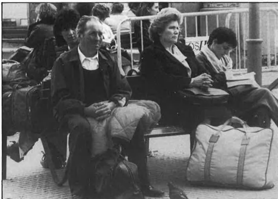
Vaga de Renfe. Iberia i la Transmediterránea n'anuncien de noves.

na Empresa de Catalunya)—, això respon a l'èxit real de l'aturada del 14-D. Si no, la conflictivitat laboral coincident no s'explicaria. La raó és que els sindicats actuen amb la força moral que els prové d'aquella data».