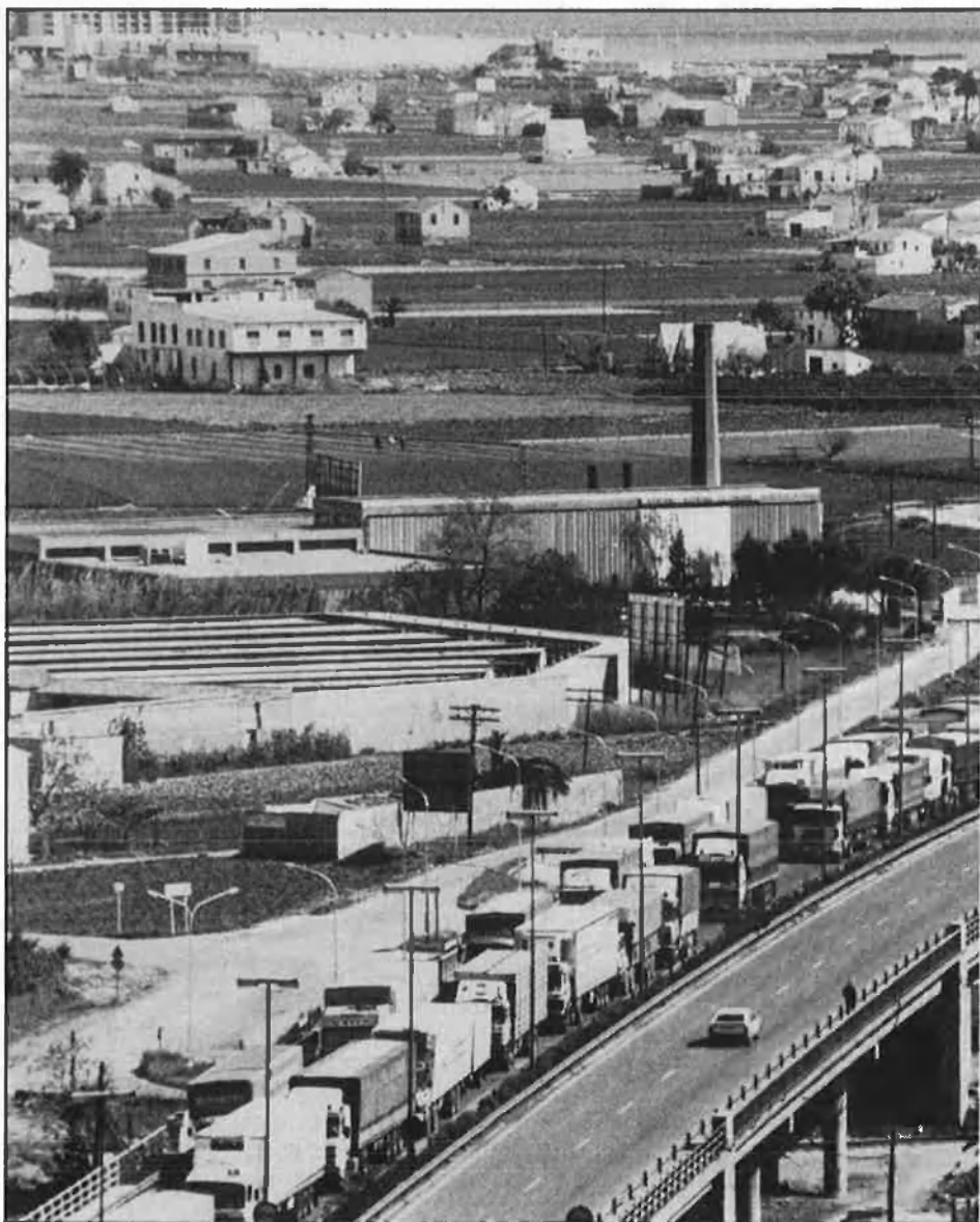
La vaga del transport de mercaderies col·lapsa València.

«¡Clar que és tracta de la negociació natural, normal!», exclama Antonio Montalbán, màxim responsable de les CCOO valencianes. «Tan sols és la continuació del 14-D respecte a les reivindicacions pròpies del mercat de treball, que ha de ser fix i no temporal. La verdadera continuïtat serà l'u de