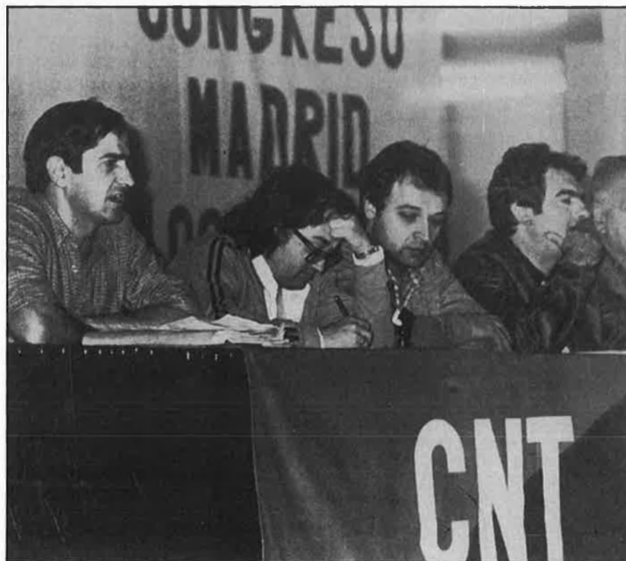
La CNT manté una actitud crítica davant les vagues.

Diversos sectors turístics han lamentat que els conflictes laborals hagen generat a Balears pèrdues econòmiques que sobrepassen els 500 milions de pesetes, arran de la cancel·lació de viatges que tenien la destinació de les Illes Balears per Setmana Santa. Les vagues, en opinió d'entitats vinculades al sector turístic, han perjudicat també la imatge de Balears en el mercat turístic peninsular. □