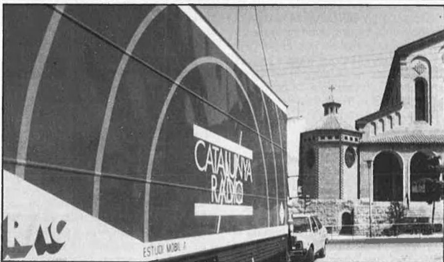
La CCRTV incompleix l'article IV de l'Ens Públic.