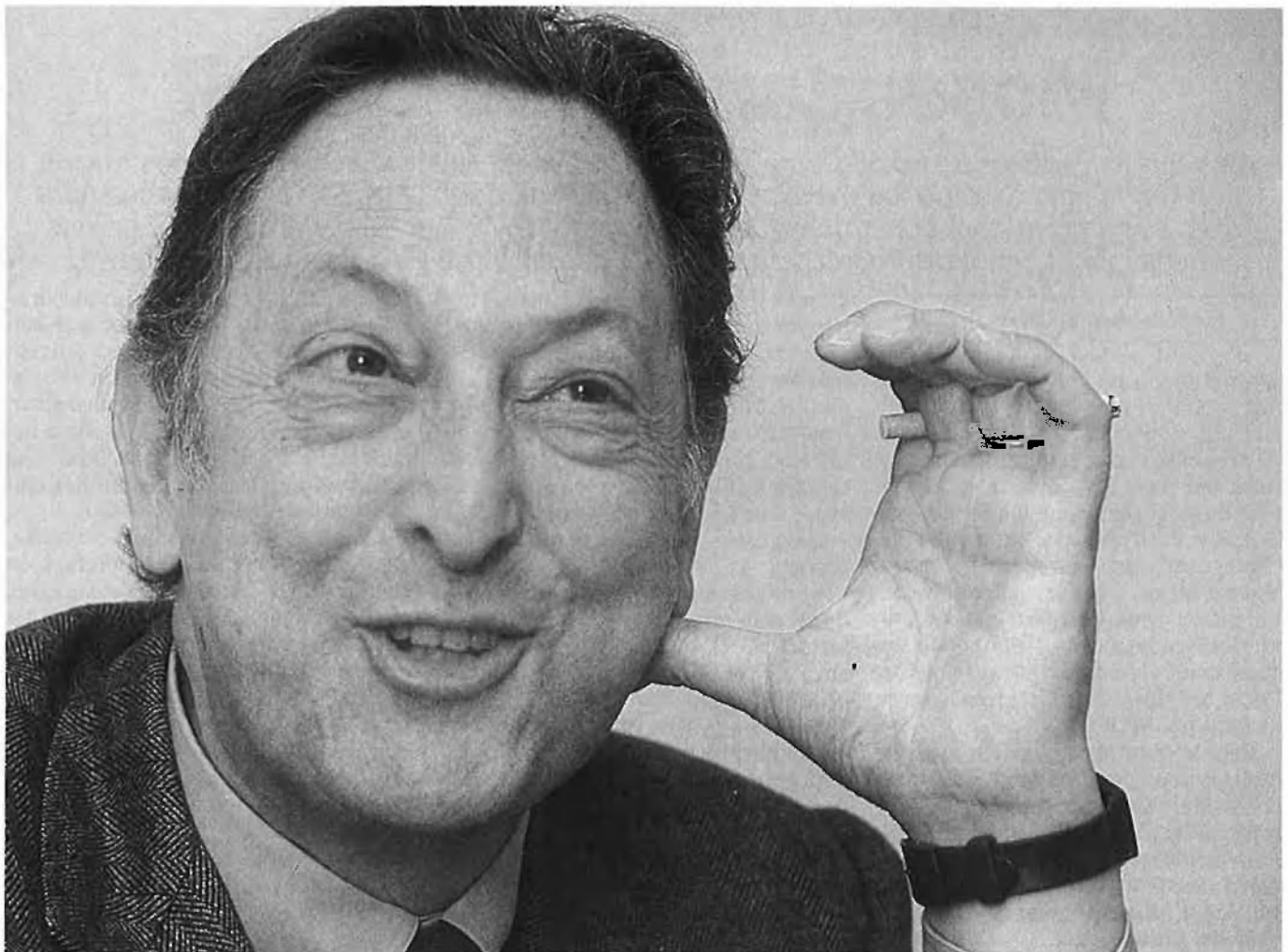
«Amb la meua faceta d'escriptor he recuperat la memòria, però també he topat amb una certa nostàlgia».