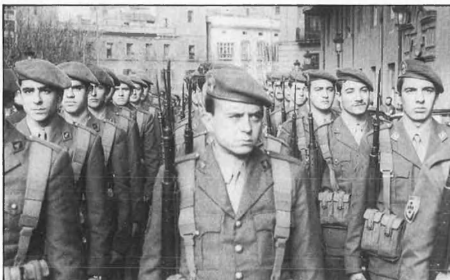
L'ensenyament castrense es complementarà amb estudis universitaris.

que explicacions sobre característiques de qui són, geoestràticament, els teòrics adversaris exteriors del país.