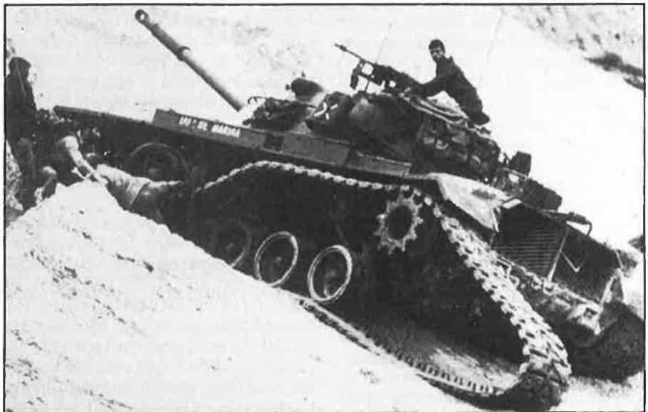
La vida activa dels militars es limita a 32 anys d'exercici a comptar des del moment en què abandonen l'acadèmia militar.

L'antiguitat per a ascendir es combinarà amb els mètodes de tria i selecció i es filarà més prim com més alt siga el rang. I aquest és el gran repte de la Llei davant de la tradició militar, perquè en el text es reserva sota una o altra fórmula per al Ministeri de Defensa (autoritat política i civil) la decisió de l'ascens.