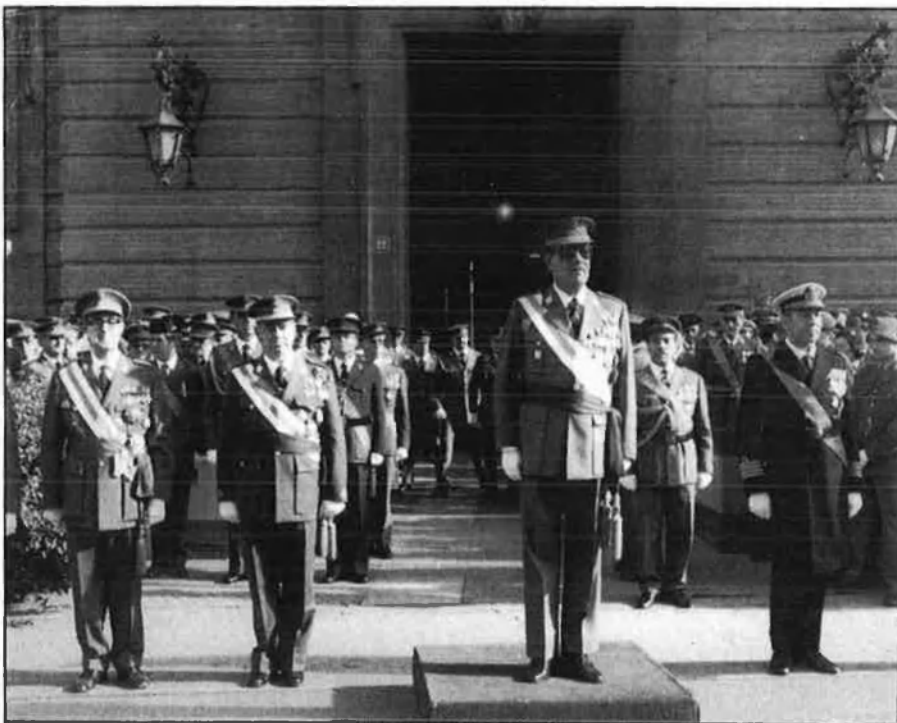
La promoció segura per simple antiguitat s'ha acabat. Els ascensos caldrà guanyar-se'ls.

Amb el que hem dit fins ara queden pràcticament definides les tres escales que s'han creat, on destaca l'aparició de la figura del suboficial major i l'obertura a l'òsmosi interescales, de forma que professionals que entren en la milícia per les escales inferiors podran optar a les superiors si realitzen els estudis pertinents, i conservaran durant aquest temps el seu grau a efectes administratius.