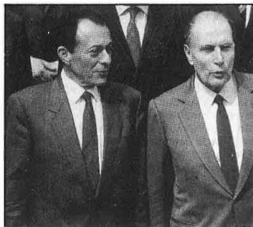
Mitterrand malgrat el desgast del poder, guanya seguidors.

L a segona volta de les eleccions municipals franceses, 19 de març, sense aportar canvis de gran transcendència, ha comportat un seguit de noves inflexions en els hàbits polítics de l'electorat francès. En primer lloc, cal destacar la creixent abstenció, que ha assolit una xifra rècord en aquesta mena d'eleccions. El fenomen ja s'havia produït en els comicis presidencials, legislatius i cantonals precedents, com també en el referèndum sobre Nova Caledònia. En segon lloc, l'atenció pot centrar-se en un fet no gaire corrent i