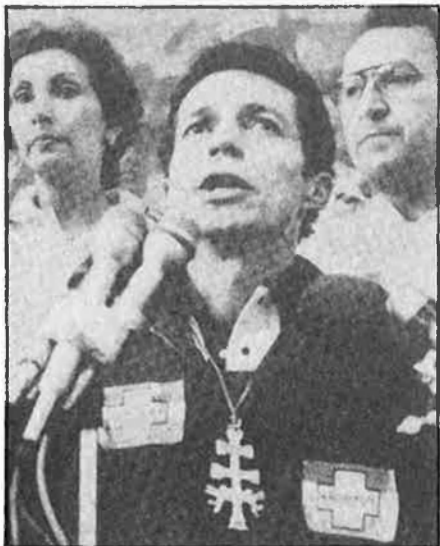
Roberto d'Aubuisson, el terror arriba al govern d'El Salvador.

E l Salvador, petit país centramerica en plena guerra civil des de fa anys, va celebrar eleccions presidencials el passat 19 de març i les va guanyar el partit d'extrema dreta ARENA (Aliança Republicana Nacionalista), que situarà el seu candidat Alfredo