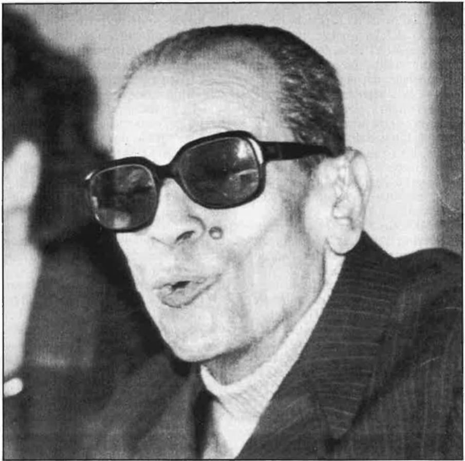
«Khomeini s'aprofita de la ignorància de les masses».

—Els crítics suposen que la Universitat d'Al-Azhar, el bastió de l'Islam