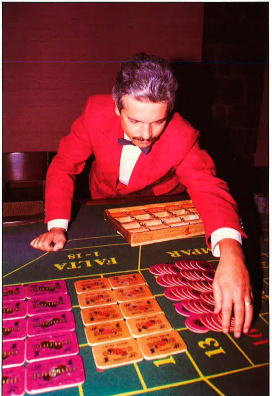
L'addicció patològica al joc és una malaltia nova per aquestes latituds.

Per sectors, les màquines escurabutxaques gaudeixen de la preferència dels jugadors, que s'enduen gairebé la meitat de la quantitat global destinada a les apostes. Les segueixen, amb molta diferència, els bingos i la Loteria, amb percentatges del 10 al 15 per cent sobre el global. I, per la cua, la travessa