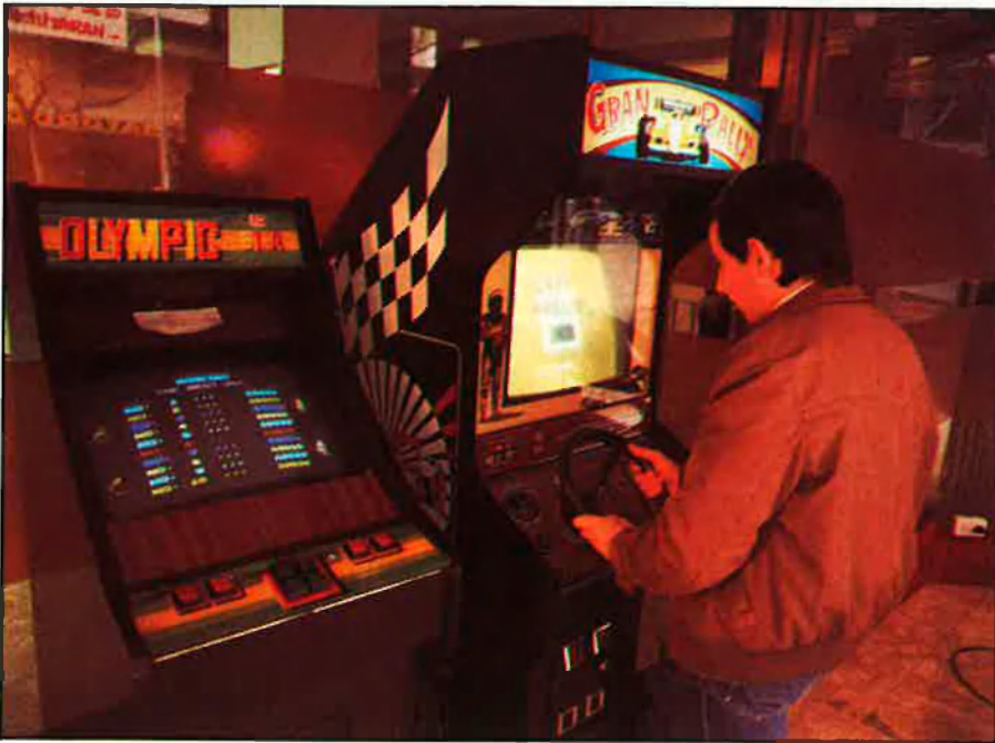
L'addicció es manifesta quan la persona que aposta comença a esperar el moment de jugar.

Pel que fa als jocs, els que més enganxen són els que requereixen una participació activa —accionar palanques, tocar botons, omplir cartrons...; els que donen una resposta immediata, els que premien amb una freqüència determinada i intermitent, i els que tenen uns estímuls addicionals —llums, músiques, sorolls.