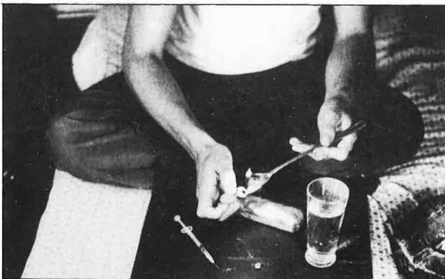
L'estat espanyol va invertir, l'any 1987, 3.000 milions de pessetes en la repressió del narcotràfic.

En aquesta croada particular que els nord-americans han desenrotllat con-