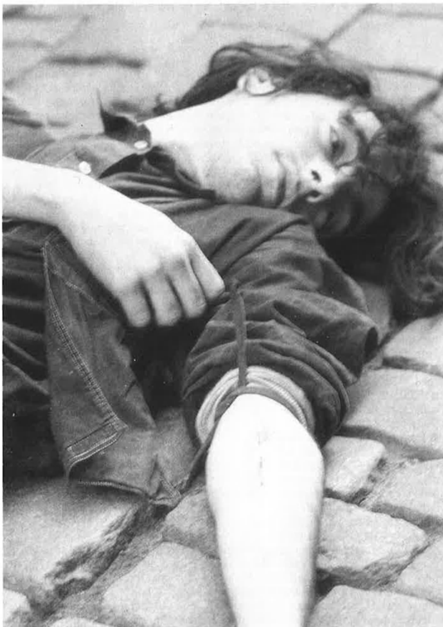
A l'estat espanyol, el 1987, van morir 189 persones per sobredosi.

El primer argument que esgrimeixen els partidaris de la persecució de la distribució i el consum d'estupefaents és