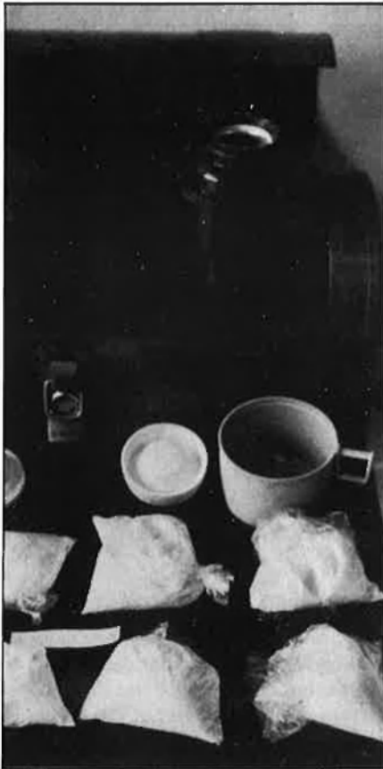
La meitat dels reclusos de les presons espanyoles compleixen condemnes per algun delictes relacionat amb la droga.

* Diputat d'Euskadiko Ezkerra al Parlament espanyol.