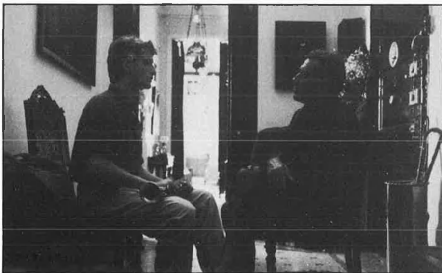
Dalt, una escena de 'La plaça del diamant'. Baix, 'Barcelona'.