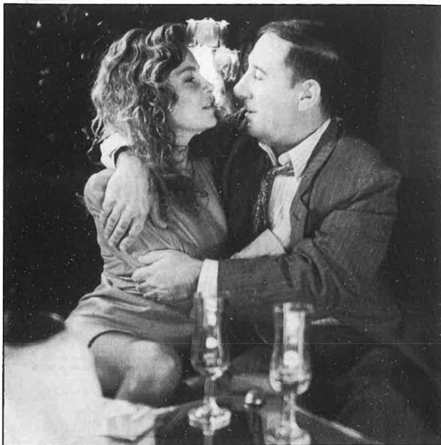
Fotograma de 'Sinatra', de Francesc Betriu.

L'obertura de nous camins se suma a una col·laboració creixent entre escriptors i cineastes. Aquesta, que ja ha donat fruits com El complot dels anells , escrita a mitges entre Bellmunt i Torrent o els treballs com a guionista d'Andreu Martín, pot ser determinant perquè la via del cinema literari no es quedi estancada i limitada a les pulcres i asèptiques adaptacions dels llibres que tots els estudiants de COU tenen en el programa obligatori de lectures. □