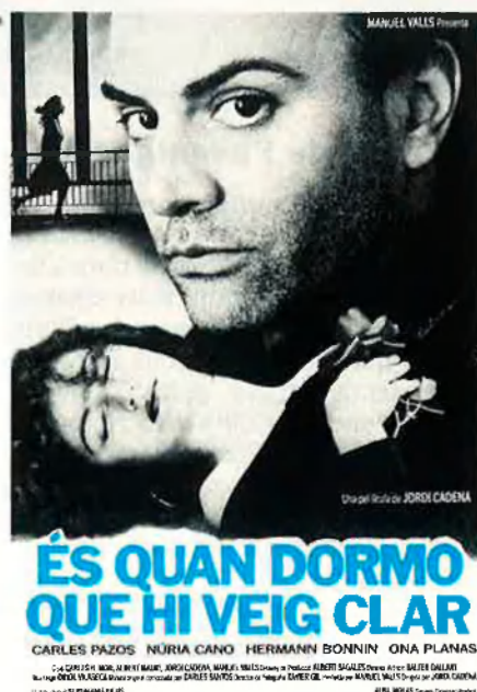
A l'esquerra, 'Vida privada'. Cartells publicitaris de l'últim cinema català.

vien fet adaptacions de dramaturgs com Guimerà o El cafè de la Marina , de Josep Maria de Sagarra.