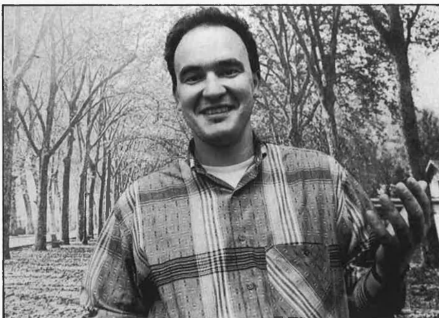
«Nosaltres som un sindicat diferent, en el sentit que mai hem perdut la vessant transformadora».

—D'entrada hi ha unes lleis que donen suport al que d'alguna manera s'anomenen opcions majoritàries. D'altra banda, l'actitud tant de les administracions com de la patronal és la d'afavorir i imposar el model de bisindicalisme, que per contra és evident que és un model en crisi. Quan el 14-D i després aquests dos sindicats demostren que tenen por d'agafar la força que els ha atorgat la mobilització popular, i de situar-se enfront les diferents administracions i la patronal, deixen clar que el sistema de bisindi-