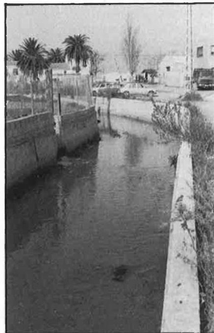
19.000 hectàrees depenen de la Comunidad de Riegos de Levante.

assemblea de maig de 1983, amb una sentència favorable de l'Audiència Territorial d'Albacete el setembre de 1988, i amb la confirmació del Tribunal Suprem. El 19 de gener passat, la Direcció General d'Obres Hidràuliques va notificar als actuals rectors de la Comunidad que abandonen el seu càrrec, després d'un procés que ha durat quasi sis anys. Mentrestant, ha començat a Riegos de Levante una lluita pel poder. El control d'una entitat de la qual depenen 20.000 agricultors és molt abellidor en un sector com l'agricultura, amb un potencial de riquesa molt elevat. I amb l'assumpte de l'aigua pel mig. □