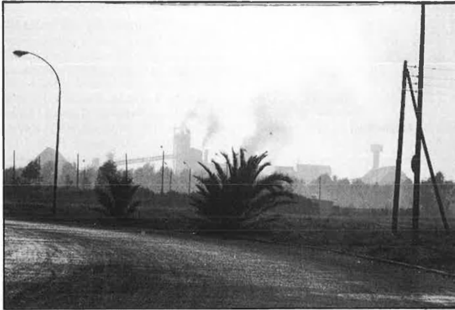
Fertiberia, a Castelló: vent verinós.