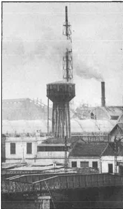
Més de quatre mil empreses ens pol·lucionen.