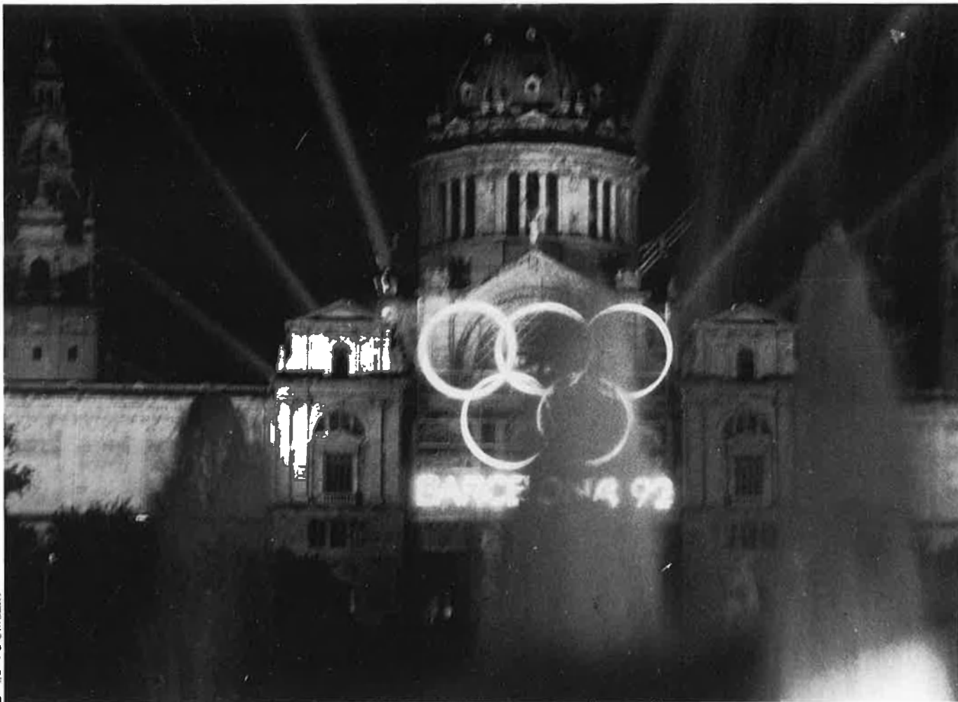
El pressupost global de l'Olimpíada Cultural és de 5.000 milions de pessetes.

bració dels jocs: el Palau de la Música, el nou Auditori Municipal i el Teatre Nacional de Catalunya, el Gran Teatre del Liceu, l'espai escènic del Mercat de les Flors i també diversos espais a l'aire lliure: des del Teatre Grec de Montjuïc fins a la plaça de la Sagrada Família, el parc de l'Espanya Industrial o el Moll de la Fusta seran escenaris de manifestacions culturals i folklòriques —possiblement en sentit ampli, barreja de cultures i de tradicions folklòriques— que pretenen integrar catalans i nouvinguts en la festa.