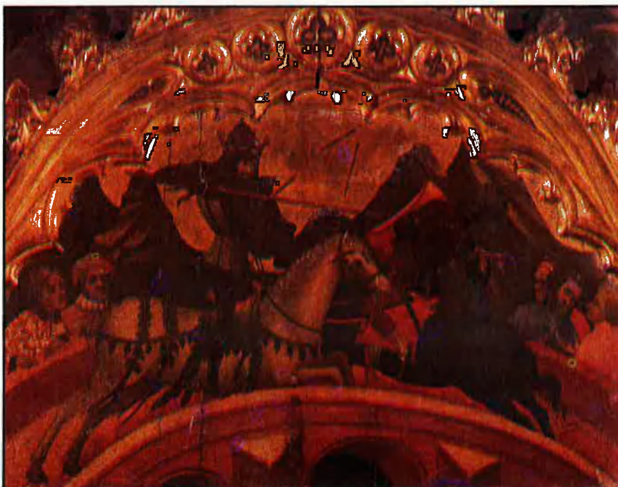
Dalt, retaule de la «Santa Creu». Baix, «Combat d'Heracli i Carsoes II».