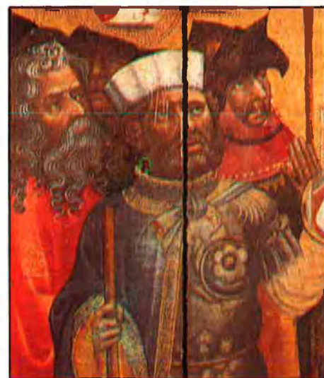
A l'esquerra, «Calvari» de Rodrigo de Osona (pare), any 1476. A la dreta, dalt, «Conversió de Sant Pau» i baix, detall.

LA PINTURA VALENCIANA DEL GÒTIC I DEL RENAISSAMENT VA ESTAR SEMPRE A L'AVANTGUARDA