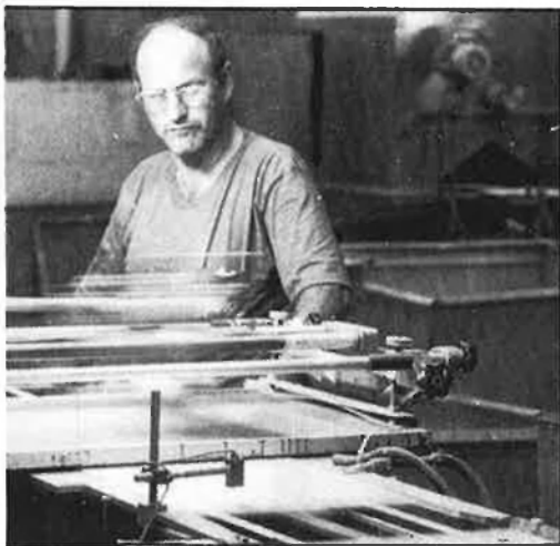
200 empreses produïren el 1988 més de 160 milions de metres quadrats de material ceràmic.

En aquests moments la gent associa la Llotja més amb un espai cultural que amb un lloc de comerç. De fet, les manifestacions culturals més importants s'exposen sempre en el saló columnari de l'edifici del gòtic civil que té aquesta institució: «Nosaltres fa uns anys vam deixar que s'hi celebrara l'exposició del Ninot. Des d'aleshores l'Ajuntament de la ciutat, amb més freqüència del que és normal, deixa el saló columnari per a tota classe d'exposicions. Pense que això és una falta de respecte a la nostra cultura comercial i al mateix temps es fa un greuge a les exposicions perquè la grandiositat de l'edifici desvirtua els objectes exposats. Ara esperem que amb la inauguració de l'IVAM, aquestes manifestacions culturals s'exposen en aquell edifici».