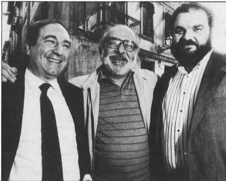
UPV i EE concorreran junts altra vegada a les eleccions europees.

Unió Mallorquina, en l'últim consell polític, a més de decidir que no pactaria amb el PP, va autoritzar el comitè executiu del partit a efectuar conver-