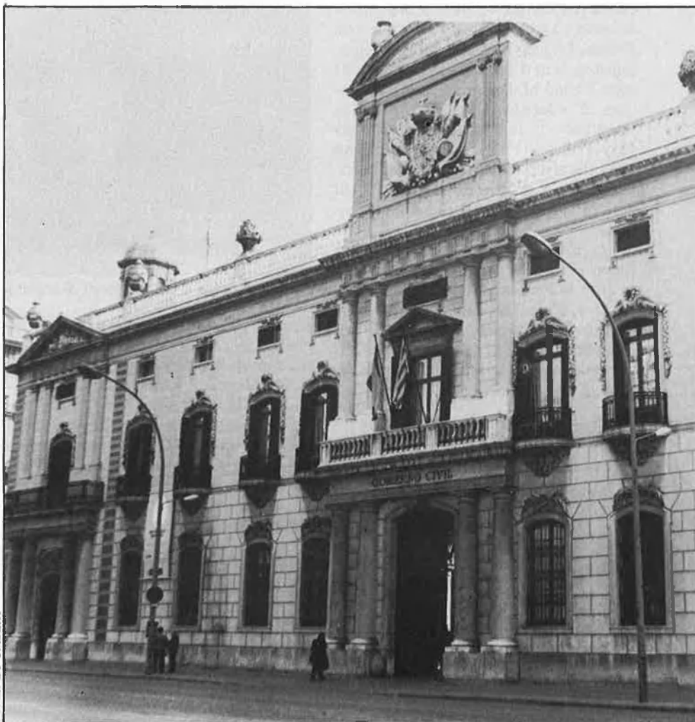
Govern Civil de Barcelona.

Però no sembla que passi res. S'ha de recordar que els GAL han comès 27 assassinats i més de trenta atemptats, i que s'han erigit, per mèrits propis, en la trama de terrorisme d'estat més greu de la dècada dels 80 en l'àrea dels països occidentals industrialitzats. En nom de la justícia, no hi valen silencis. □