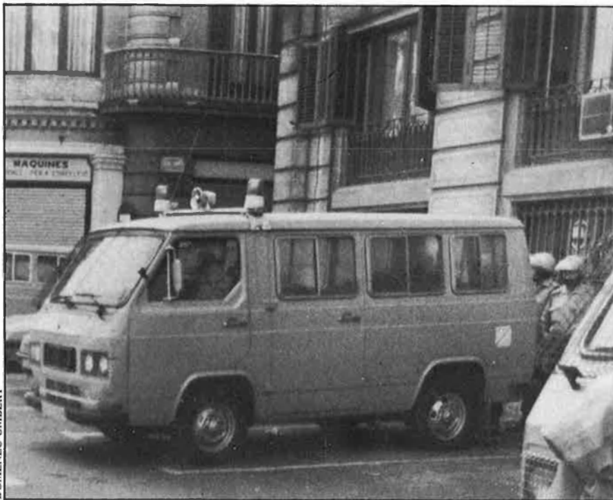
Prefectura central de policia a Barcelona.