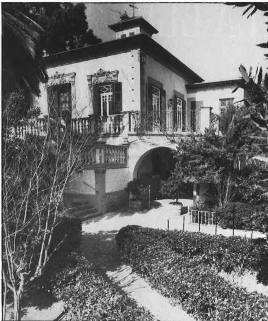
Torre de Rocafort on Machado va viure durant la seua estada a València el 1937. Hi escrigué el seu últim llibre 'La guerra'.