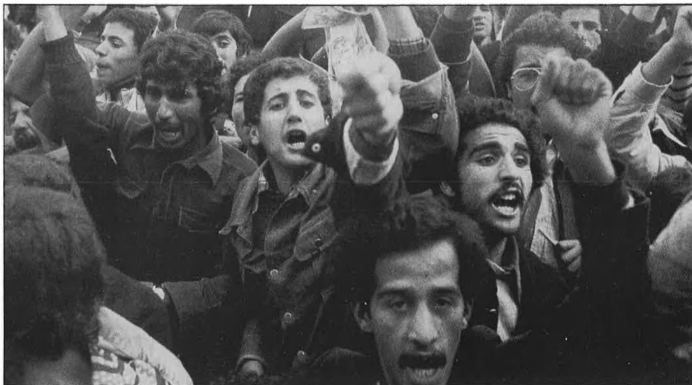
Una població en constant creixement, principal problema estructural d'Algèria.

Els francesos i, segurament també, aquells que van portar el FAN al go-