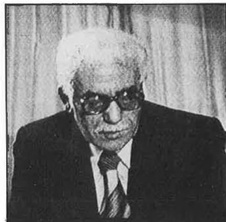
Chadli Benjedid, ratificat.

D'aquella pel·lícula, però, els minuts més colpidors eren els últims. L'exèrcit francès eliminava sense contemplacions les últimes restes de lluita armada a l'interior de la ciutat. La batalla de Argel (nom de la pel·lícula i també nom clau donat pel general Massu a l'operació d'extermini de les forces nacionalistes), era considerada oficial-