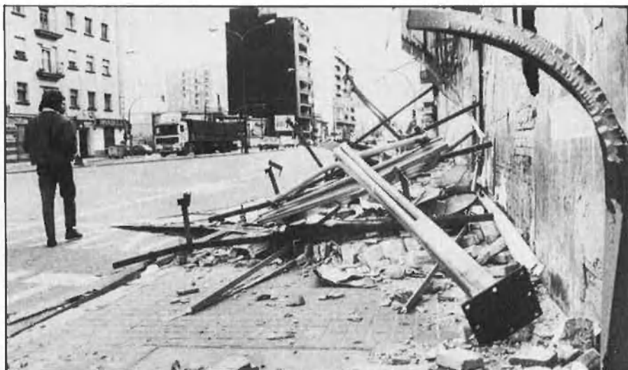
Tanques publicitàries, teulades, arbres centenaris..., un espectacle dantesco.