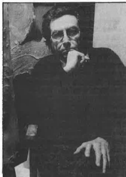
Picasso, Dalí i Tàpies, a l'alça.