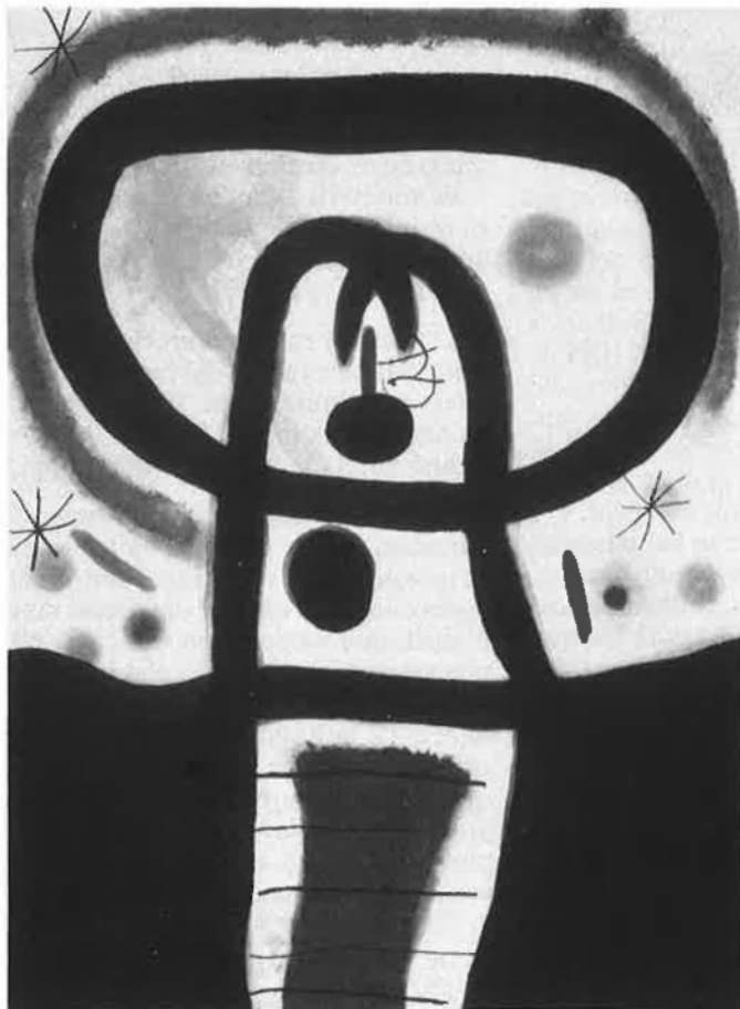
Joan Miró va disposar la venda d'algunes obres del fons de la Fundació per a permetre el seu manteniment.

Tot i així, sempre hi haurà qui farà de l'art un valor refugi, una inversió segura que li permet escapar dels controls fiscals i de la inflació. En un cas extrem, es pot afirmar que la màfia blanqueja part dels seus diners a través del mercat de l'art. Les possibilitats que ofereix l'actual legislació espanyola, i el fet que —al costat de l'estat— la gran col·leccionista hagi estat l'església, com també la bàrbara espoliació del patrimoni durant la dictadura, i el baix nivell cultural i econòmic, explicarien per què, malgrat tenir creadors brillants i reconeguts, el comerç de l'art i els grans marxants descobridors siguin de fora. A Europa, on l'empenta especuladora ha estat tan forta, es comercialitza ja la pintura i l'escultura religiosa, per a les quals s'havia guardat fins ara un cert respecte, si no oblit. El mateix es pot dir pel que fa a les peces arqueològiques i la ceràmica. L'art s'ha convertit en moneda de canvi. I no escapa a ningú que l'excés de consum que això comporta pot fer caure l'artista en una sobreproducció perillosa. □