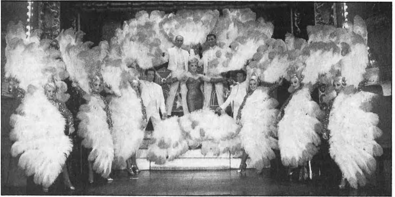
El Molino és molt especial i vol que la gent que hi treballi tingui una característica, que siguin 'molineres'.

els Joglars o els Dagoll Dagom, o venir al Condal porta un públic nou al Paral·lel, un públic que un dia pot ser d'El Molino. Sense el Paral·lel no s'haurien pogut fer els recents homenatges de la Margarida Xirgu, ella va treballar al Paral·lel. Ni s'hauria pogut fer un monument a la Raquel Meller.