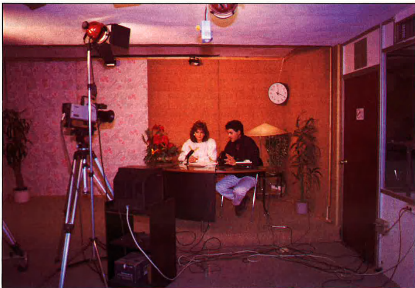
Estudis i presentadors de 'Radio Exprés', dues hores de televisió en directe.

en marxa de l'esdeveniment va eixir de la butxaca de professionals i industrials il·licitans, que arribaren a aportar-hi vora vuitanta milions de pessetes. TeleElx ha mogut durant aquest anys i mig de funcionament 500 milions de pessetes i en l'actualitat obté, cada mes, ingressos que voregen els 20 milions i que provenen del pagament de les quotes mensuals (1.500 pessetes) d'abonats i de la publicitat, l'augment de la qual està fent-se visíble en els darrers mesos. Això no obstant, aquests importants ingressos no són, segons el conseller delegat, suficients per a amortitzar la inversió, ja que les despeses que ha d'afrontar l'empresa s'acosten als 18 milions de pessetes al mes.