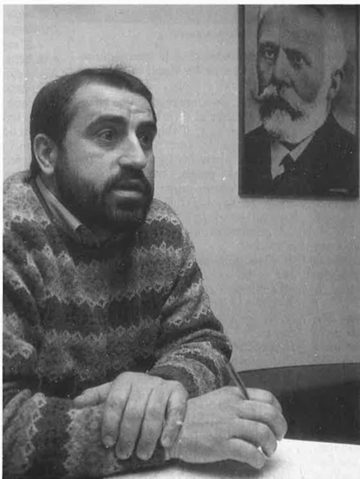
«El govern socialista ha matat la pau social».

—No té res a veure perquè s'estan discutint problemes diferents. El govern de la Generalitat valenciana no té res a dir, per exemple, quant a la situació dels jubilats, i en els temes que s'ha hagut de pronunciar ho ha fet. Així, hem arribat a un acord en el tema dels funcionaris, un acord que a Madrid se'ns nega, perquè ací el govern valencià s'ha mogut amb més habilitat. Si el govern valencià no haguera tingut aquest comportament, segur que la UGT s'hauria confrontat amb