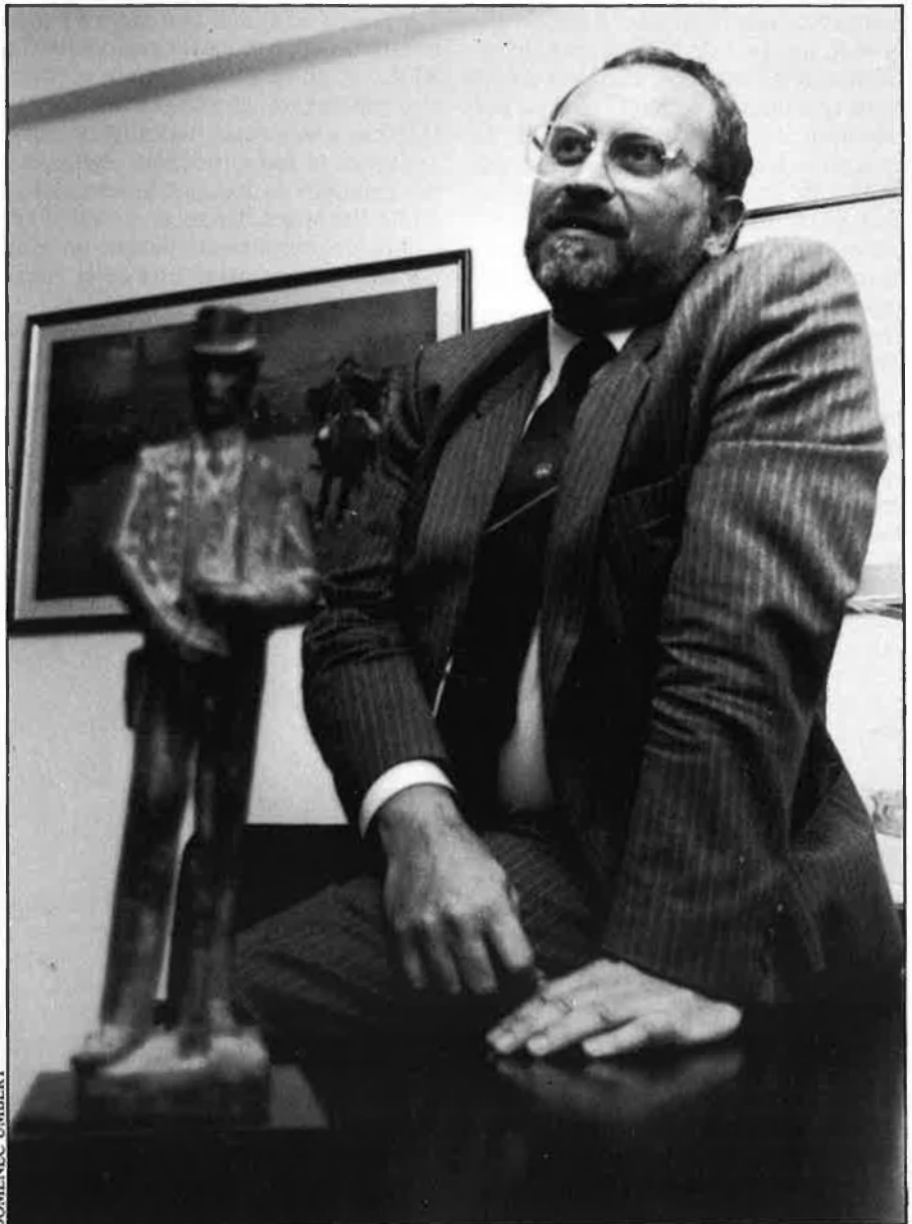
«Sóc absolutament partidari de la policia pública».

—Crec que han de desaparèixer. Quan es parla de les empreses privades de seguretat intento no cometre mai l'error de parlar de policies privades. Policia només n'hi ha una, i és la pública. L'altra són excrescències que es produeixen a la realitat i jo no voldria mai que a l'Escola de Policia de Catalunya entressin policies privats. Crec que caldria revisar la legislació que hi ha sobre el tema de les policies privades, en un sentit clarament limitatiu, restrictiu. □