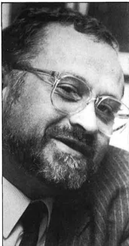
«Em poso com a objectiu la construcció de l'Escola de Policia de Catalunya».

—¿Vostè ha notat que en aquests moments hi ha una voluntat política decidida per part del govern de la Ge-