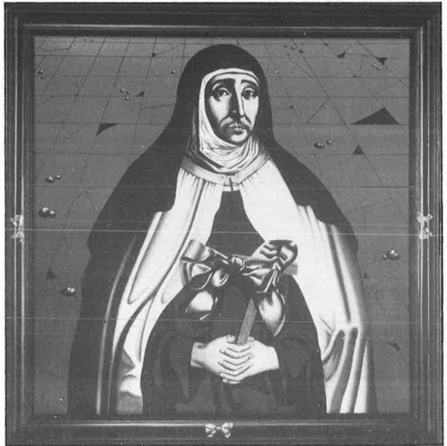
Equip Crònica. 'El pati de les temptacions'.

Presentat la tardor de 1984 com un projecte de col·laboració conjunta entre l'Ajuntament, la Diputació i la Conselleria de Cultura, l'IVAM concretava, amb la construcció d'un edifici de planta (Emili Giménez i equip), l'adquisició d'unes col·leccions d'art