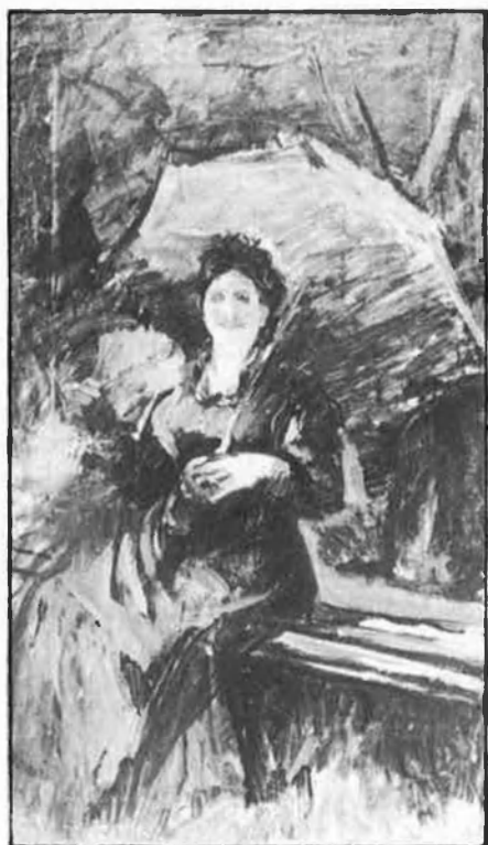
Pinazo, un dels eixos artístics de l'IVAM.