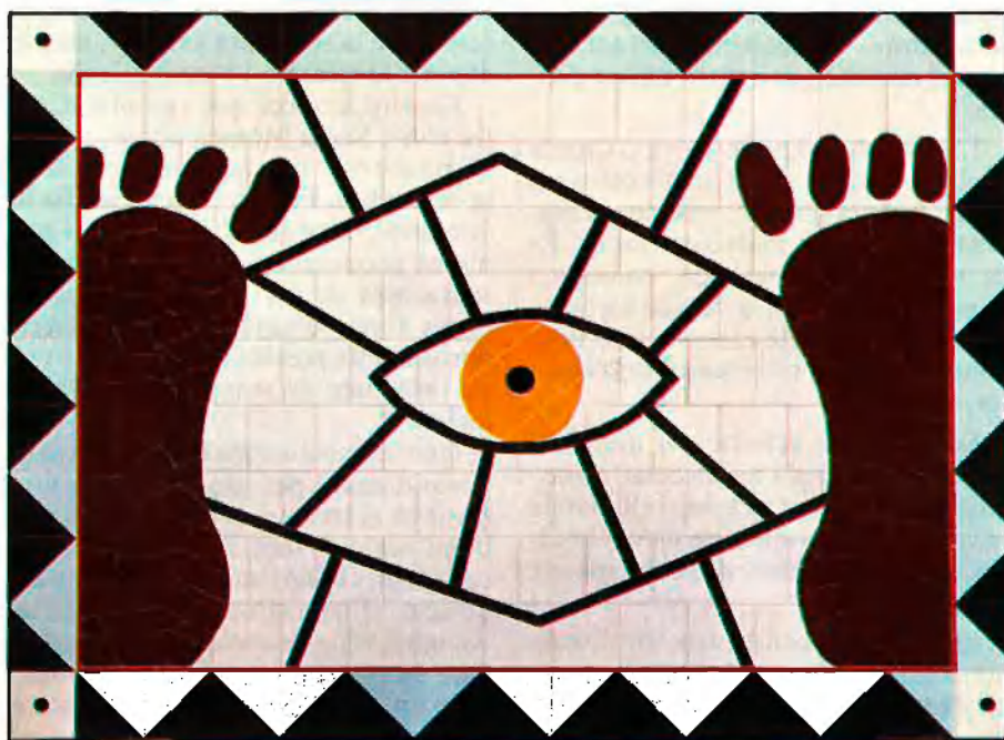
Un discurs descentrat, excèntric, que qüestiona els sistemes jerarquitzats.

La Casa de la Caritat i el Centre d'Art Santa Mònica exposaran a partir del 2 de febrer i fins al 2 d'abril les teles, els mosaics i les escultures de l'artista mallorquí fincat al Principat. Introspecció i abstracció defineixen la seva producció recent.