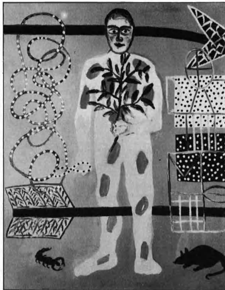
Polígon 1988 (tècnica mixta sobre tela).

ca en aquest camp, s'ha decantat posteriorment i de manera decidida pel vessant pràctic.