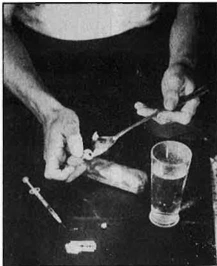
L'ús comú de xeringues és el principal mitjà de transmissió de la sida.

ha al País Valencià, segons la Comissió de Tecnics del sida de la Conselleria de Sanitat són 196. La distribució per províncies és la següent: 147 casos a València, entre els quals hi ha 30 dones afectades i 117 homes; 34 a Alacant, 4 dones i 30 homes, i 15 a Castelló, 4 dones i 11 homes. □