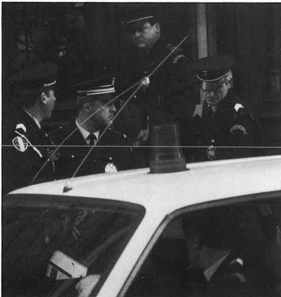
La policia francesa amb la seva pressió ha aconseguit en pocs anys la detenció de la major part de la cúpula d'ETA.

En medis polítics espanyols es creu que és l'última oportunitat seriosa d'acabar amb la lluita d'ETA per una via de diàleg. Si aquest intent es frus-