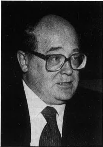
José Ma. Cuevas, president de la CEOE.