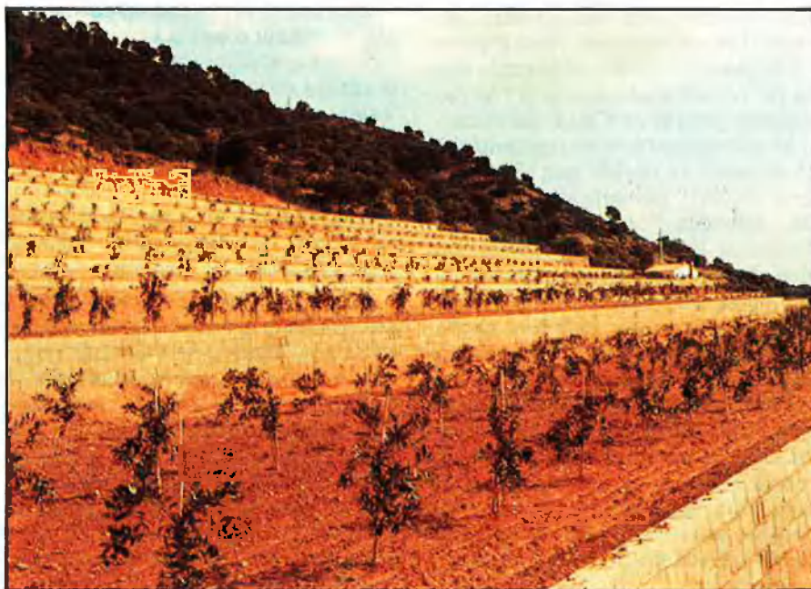
Els viviers d'Alcanar comercialitzaren el 88 més de 4 milions de plançons de cítrics.

També hi ha els Viviers Cid (amb seu a València), Viviers València (seu a Peníscola), Viviers Mas de Fabra (Benicarló) etc., amb majoria de personal canareu. A banda d'això, s'han de tenir en consideració els petits productors d'Alcanar que, pel seu compte, s'hi dediquen i que encara ho fan amb peu amarg, el taronger del terreny. També segons A. Subirats, l'entrada de l'estat espanyol a la CEE pot significar que aquesta intervinga en el sector, per a controlar els excedents de producció, cosa que pot significar que es limite el planter a mig terme. El mercat està embussat i, si la Comunitat arriba a impedir que es planten més arbres, els viviers poden fer fallida i pot aparèixer l'atur al sector. D'altra banda, cal dir que no hi ha pràcticament exportació, ja que països productors de cítrics (com ara EUA, el Marroc i Cuba) que podrien ser compradors, ja tenen infraestructura pròpia. □