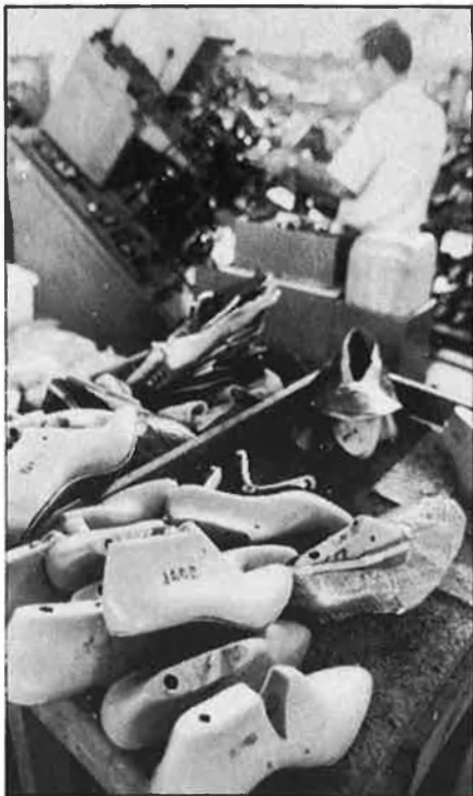
La reconversió ha influït negativament al treball submergit del calcer.