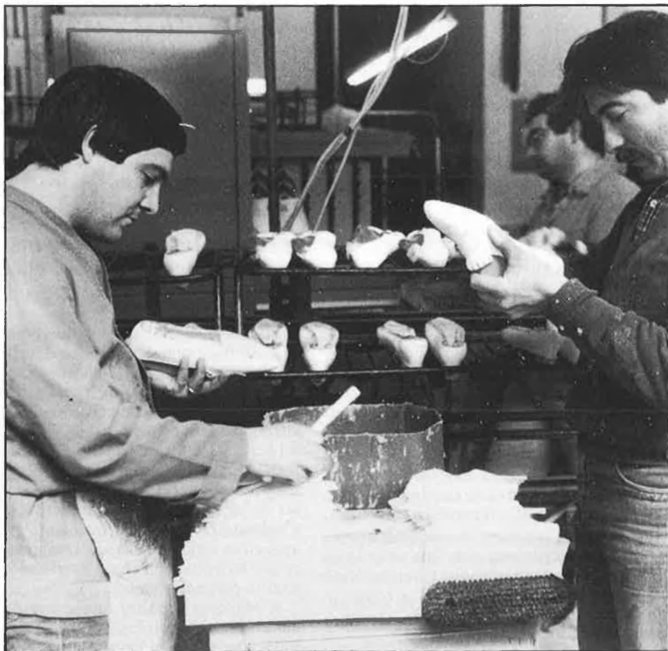
Els treballadors del calcer han trobat en les Societats Anònimes Laborals una alternativa al tancament d'empreses.

«És lamentable que els treballadors opten per acudir a les assessories laborals perquè els solucionen ràpidament el seu problema particular sense enfrontar-se a la injustícia que suposa sacrificar els seus drets adquirits, com ara l'antiguitat, a canvi de cobrar ràpidament la indemnització o passar a dependre de l'INEM», reconeix un responsable de CCOO.