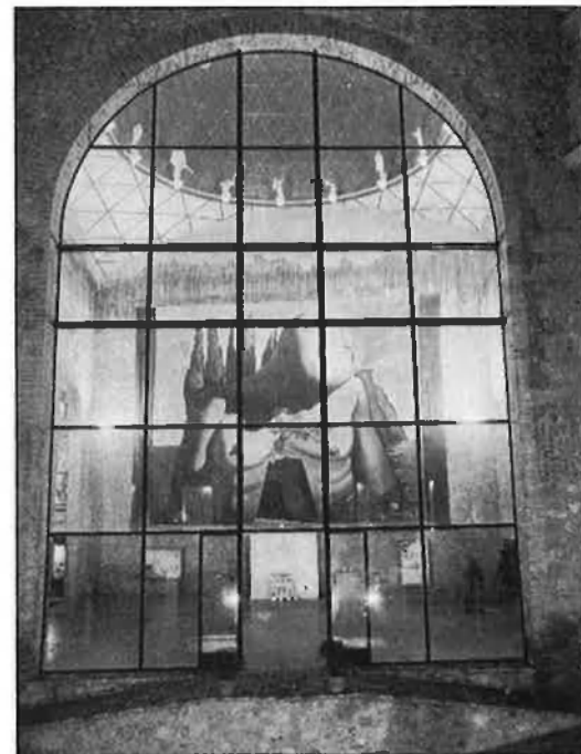
Museu Dalí de Figueres.