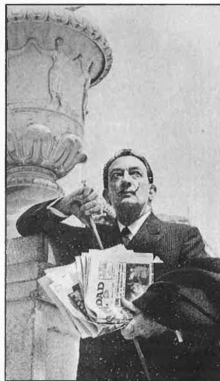
Un home desconcertant amb un lloc a la història.

Descriure uns trets biogràfics de la vida de Dalí, sense caure en un recitat purament cronològic, significa cercar un esquema global. Reconèixer la seva complexitat no és més que un punt de partida a l'hora de cercar defini-