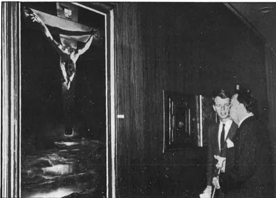
Dalí, amb Robert Kennedy durant una exposició a Nova York.

* Director del Museu d'Art Contemporani de Catalunya